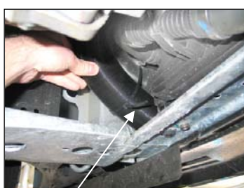
Fig. # 27