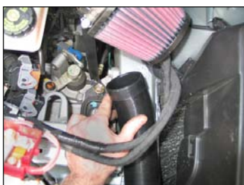
Fig. # 29