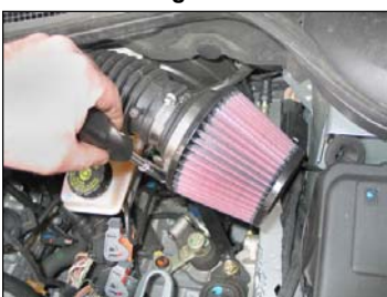
Fig. # 25