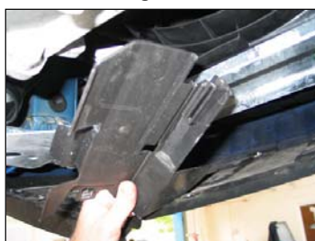
Fig. # 26