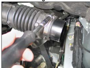
Fig. # 22