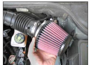
Fig. # 24