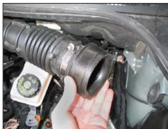
Fig. # 23