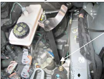
Fig. # 21