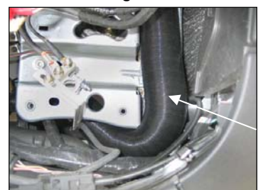
Fig. # 28