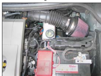
Fig. # 30