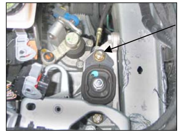
Fig. # 20