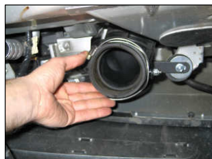
Fig. # 10