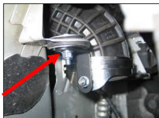
Fig. # 9