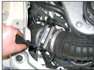
Fig. # 2