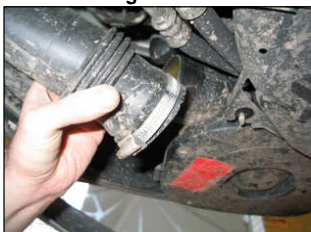
Fig. # 4