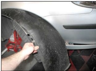
Fig. # 1

FILTER MAINTENANCE: K&N suggests checking the filter periodically for excessive dirt build-up. When the element becomes covered in dirt (or once a year), service it according to the instructions on the Recharger service kit available from your K&N dealer, part number 99-5003EU.