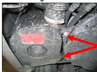
Fig. # 6