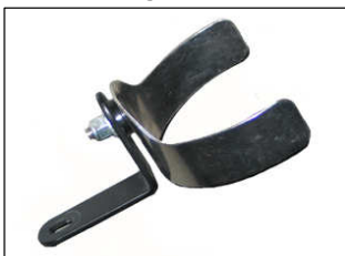
Fig. # 8