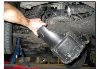
Fig. # 7