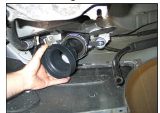
Fig. # 11