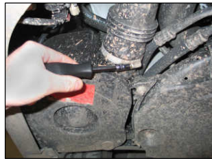
Fig. # 3