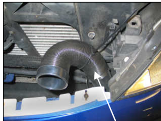
Fig. # 18