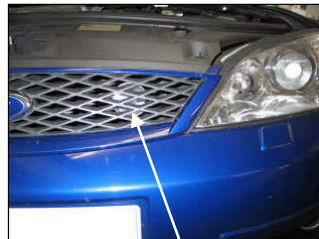
Fig. # 19