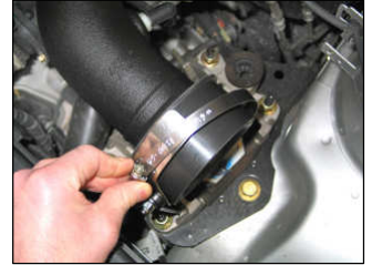
Fig. # 12