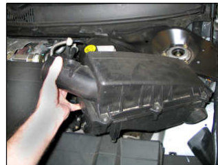
Fig. # 3