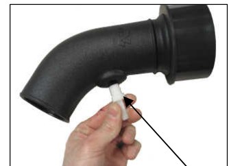
Fig. # 8