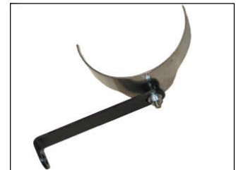
Fig. # 4