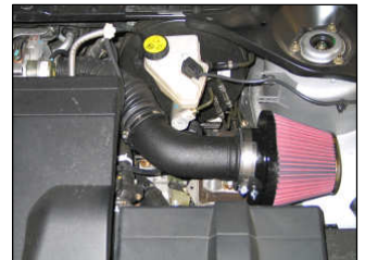
Fig. # 20