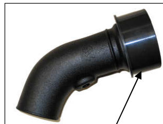
Fig. # 7