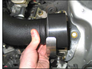
Fig. # 11