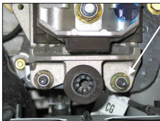
Fig. # 5