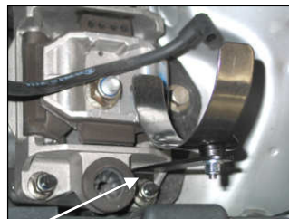
Fig. # 6