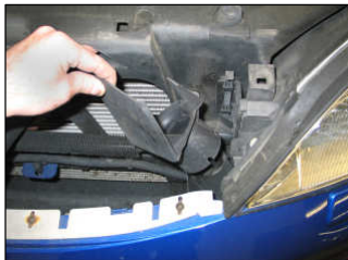
Fig. # 17