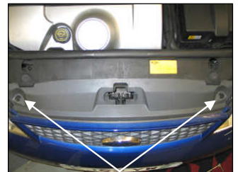
Fig. # 16