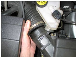
Fig. # 1

For cleaning instructions please visit our website: www.knfilters.com/cleaning