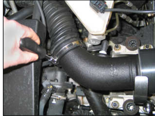
Fig. # 10