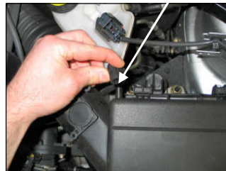
Fig. # 2