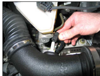
Fig. # 15