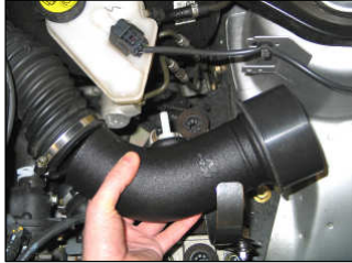
Fig. # 9