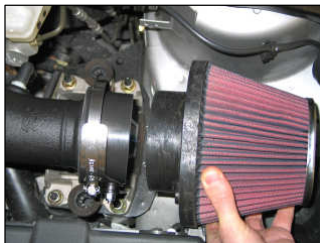
Fig. # 13